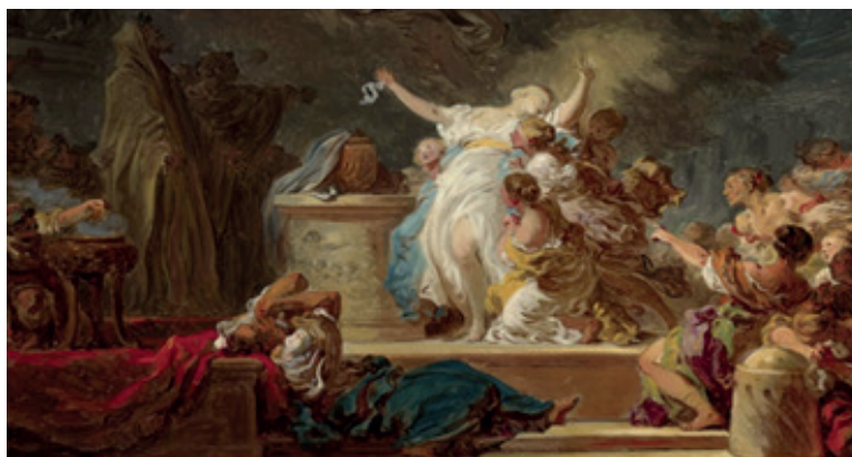
Jean-Honoré Fragonard, (français, 1732 – 1806), Un sacrifice antique , dit Le sacrifice au Minotaure

« Quand les Crétois ont conquis notre bonne ville d'Athènes, ils nous ont imposé une punition : tous les neuf ans, nous devons sélectionner quatorze jeunes gens, parmi les plus nobles de la cité. Sept filles et sept garçons. Ils sont envoyés en Crète, à Cnossos, où ils sont dévorés par un affreux monstre qu'ils ont là-bas. »