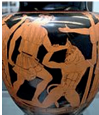
Thésée et le Minotaure, détail d'un stamnos attique à figures rouges par le Peintre d'Altamura, v. 460 av. J.-C., Staatliche Antikensammlungen de Munich.