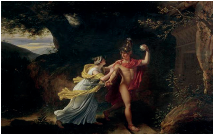
Jean-Baptiste Regnault, Ariane et Thésée , peinture à l'huile, bois, 1829