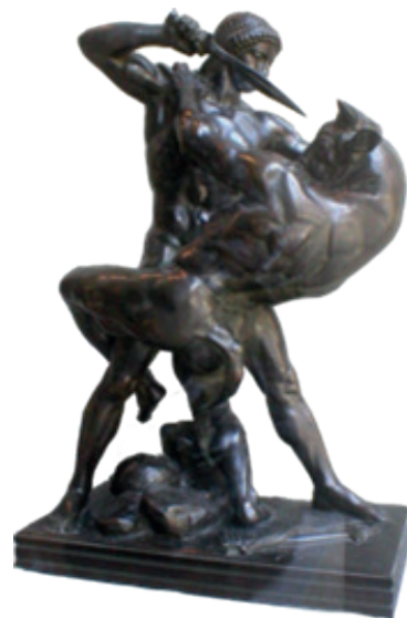
Antoine-Louis Barye, Thésée combattant le Minotaure , sculpture en bronze d'après le modèle en plâtre de 1843, musée du Louvre, Paris.