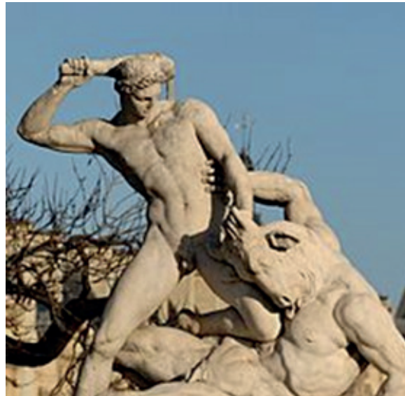
Thésée affrontant le Minotaure , d'après une sculpture de Jules Ramey, marbre, 1826, exposée au jardin des Tuileries, à Paris.