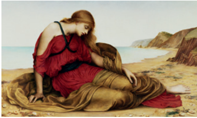
Evelyn De Morgan, "Ariane abandonnée sur l'île de Naxôs"