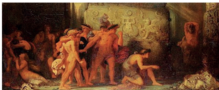
Les Athéniens livrés au Minotaure dans le labyrinthe de Crète par Gustave Moreau, 1855, musée de Brou