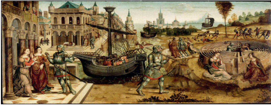
Maître des Cassoni Campana, Thésée et le Minotaure , entre 1510 et 1520, peinture sur bois.