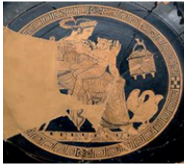
Pasiphaé et le Minotaure. Kylixattique à figures rouges, 340-320 av. J.-C., Cabinet des médailles de la Bibliothèque Nationale de France.