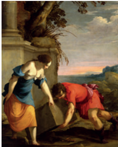
Laurent de la Hyre, Thésée retrouve les armes de son père ou Thésée et Oethra .

1. Remets les œuvres précédentes dans l'ordre de la narration.