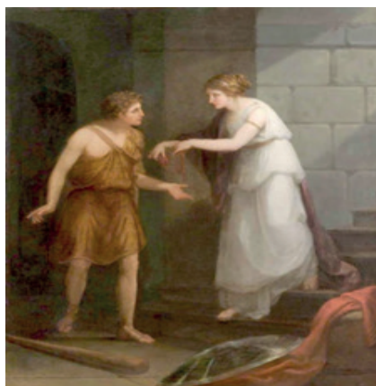
Angelica Kauffmann, Ariane donne une pelote à Thésée , 18 ème siècle.