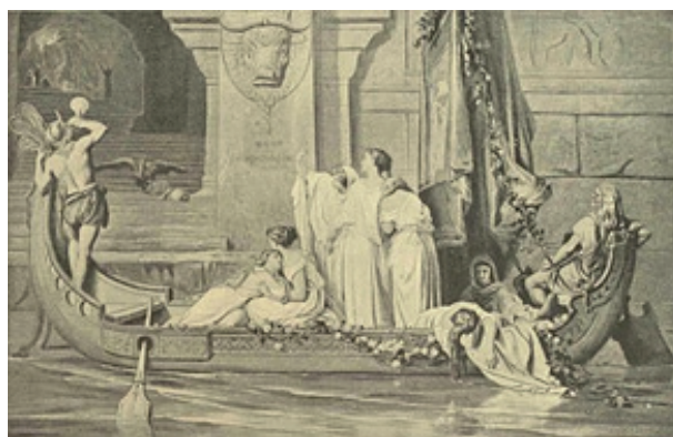
Les victimes sacrificielles du Minotaure sur une illustration de Charles Francis Horne, 1894